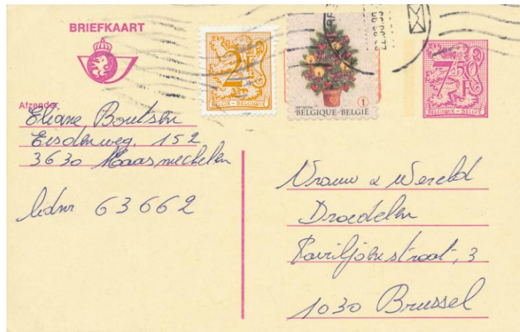
Briefkaart uitgifte 1982 met bijfranking 50 centiem en 2 Fr in het postkantoor of 10 Frank voor het tarief van 1.02.1984.

Nu zullen we enkele voorbeelden zien hoe overgefrankeerde poststukken te beschrijven en in een verzameling op te nemen.