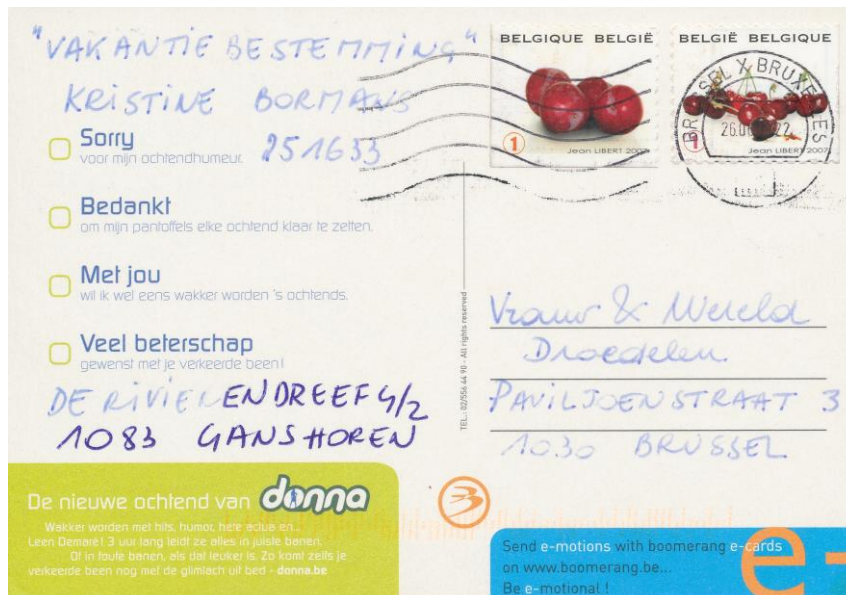
Zichtkaart verzonden 26.06.2009. Het jaartal staat op een donkere kers. Dubbele frankering.

Het begrip eeuwig geldig is er bij de modale verbruiker misschien nog niet ingegaan. Hoeveel geld wordt er verspild?