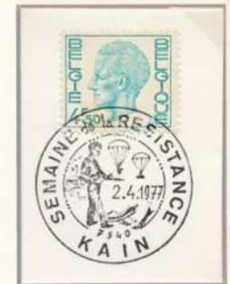
Deze opdrachten waren tijdens WO II voornamelijk steun aan de gewapende weerstand en speciale sabotage opdrachten. De droppings gebeurde bij nacht.