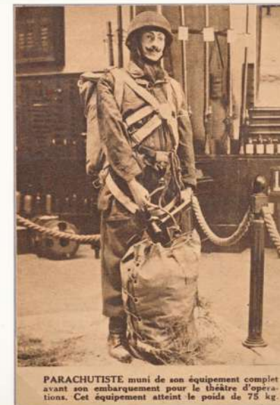
Uitknipsel Le patriote Illustré" van 24.2.1946... opening Para-Commando afdeling in het leger museum in Brussel

De rode muts onderscheidde de Britse van de Amerikaanse parachutisten. Maar bij de dropping waren de Amerikanen beter uitgerust en ze hadden een reserve valscherm.