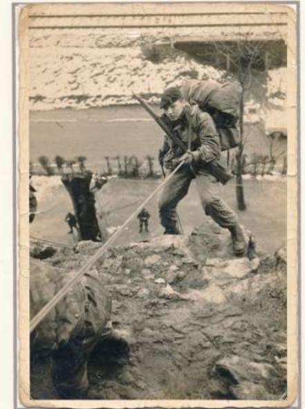
Commando training december 1964 Marche les Dames.