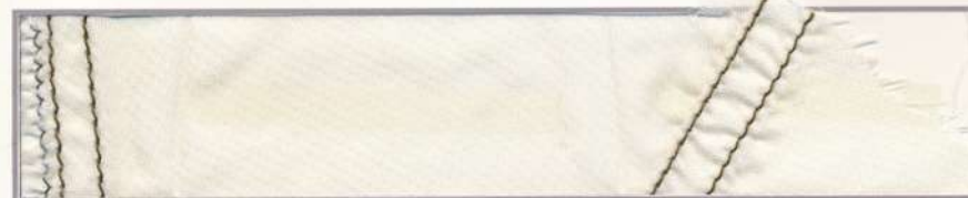
Stukje nylon van de koepel van een Amerikaanse parachute. Dubbel gestikt

Voor wereldoorlog II werden voornamelijk in Duitsland en Rusland luchtlandingstroepen opgeleid. Het gebrek aan aangepaste vliegtuigen en kwalitatief valschermtexiel was een probleem. Specifieke uitrustingen werden ontworpen.