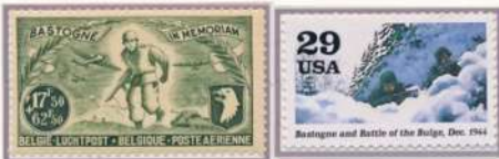
Tijdens WO II rustten de geallieerden 3 luchtlandingsdivisie uit. Zowel valschermspringers als zweefvliegtuigen maakte er deel van uit. Deze elite eenheden werden ook ingezet als infanterie.