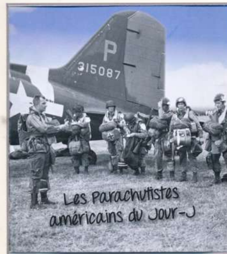
Flyer van het Airborne Museum in Sainte-Mere- Eglise.

Voor wereldoorlog II werden voornamelijk in Duitsland en Rusland luchtlandingstroepen opgeleid. Het gebrek aan aangepaste vliegtuigen en kwalitatief valschermtexiel was een probleem. Specifieke uitrustingen werden ontworpen.