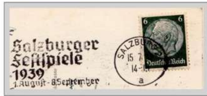
het festival van 1939 eindigde niet op 8 september

De oprichters van de Festspiele, waaronder Strauss en Reinhardt , willen Salzburg laten erkennen als de culturele "Mozart-stad".