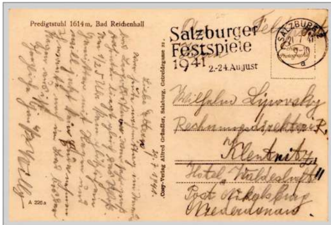
◀ "Feldpost" in potlood

Het festival van 1939 werd één week vroeger gestopt omdat de Duitse bezetter Polen ging binnenvallen.