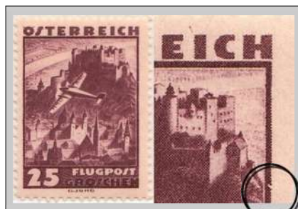
Salzburg VARIËTEIT breuk in rand

De oprichters van de Festspiele, waaronder Strauss en Reinhardt, willen Salzburg laten erkennen als de culturele “Mozart-stad”.