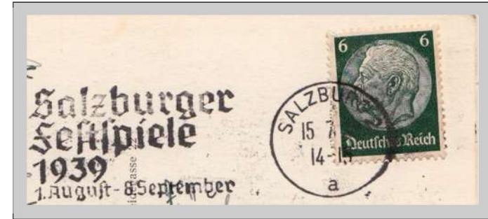
het festival van 1939 eindigde niet op 8 september

Het festival van 1939 werd één week vroeger gestopt omdat de Duitse bezetter Polen ging binnenvallen.