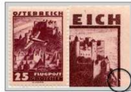
Salzburg VARIÉTÉIT break in rand

De oprichters van de Festspiele, waaronder Strauss en Reinhardt , willen Salzburg laten erkennen als de culturele "Mozart-stad".