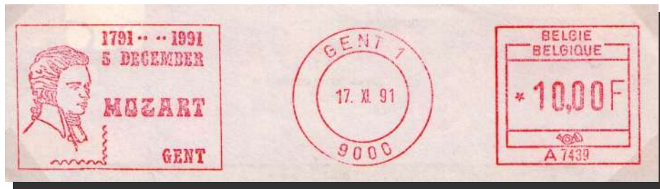
type Frama G4

De familie Mozart reisde verder naar Gent op weg naar prinses Caroline in Den Haag.