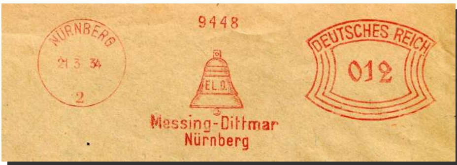
een beiaard heeft minstens 23 klokken type Francotyp "A"

De familie Mozart reisde verder naar Gent op weg naar prinses Caroline in Den Haag.