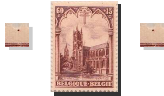
kathedraal van Gent VARIËTEIT puntjes in bovenrand

We weten dat de familie de beiaard van de kathedraal zag omdat de dochter Nannerl Mozart de treden telde van de toren.