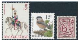
Postzegels 32 Bef