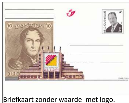
Briefkaart zonder waarde met logo.