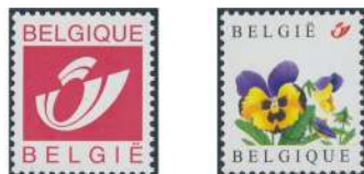
Postzegels zonder waarde met logo

De langlopende reeksen met koning, leeuwje of vogels hebben geen jaartal, maar blijven evengoed geldig. Ook de combinatie Bef, € en zonder waarde is toegestaan.