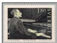
(1885) Wilhelm Stenhammar wrote his Three Fantasies (Op.11), based on Mozart's Fantasy .