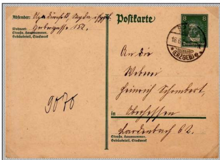
1927 Germany, postal stationery with 8 Pfennig to foreign countries in use from 1 August 1927.

In March 1787 Beethoven travelled from Bonn to Vienna, in the hope of studying with Mozart.