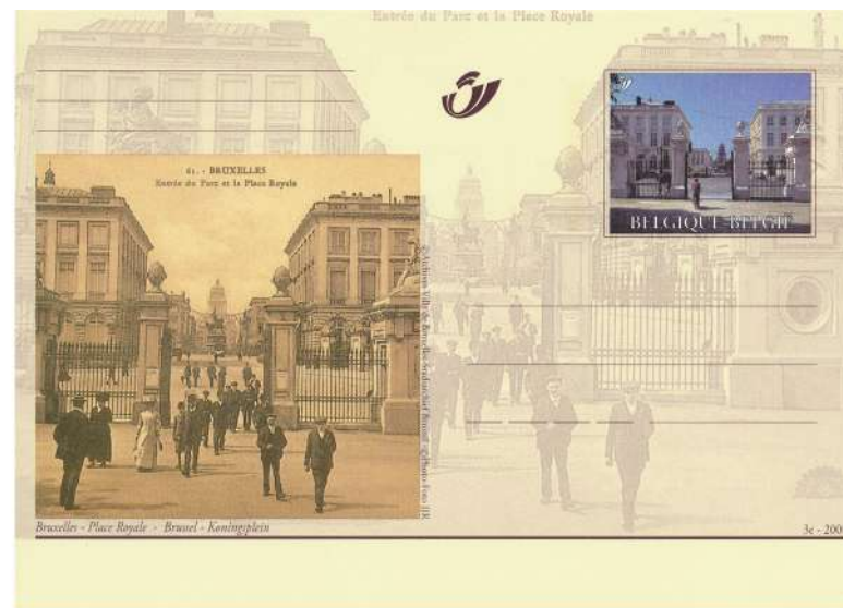
As van de macht, van de Warande over het koningsplein naar het justitiepaleis. Waar Godfried van Bouillon u staat, stond het standbeeld van Karel van Lotharingen.

Wil men het tonen, dat kan om de twee jaar in het kader van Ke.The.Fil met de één blad wedstrijd.