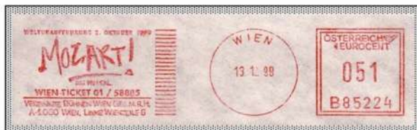
type Frama "M/E bzw. 100"

The Fantasy in C minor (K.475) was published with a dedication to Thérèse von Trattner, one of his pupils in Vienna.