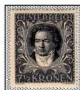
Beethoven by August Kloeber

In March 1787 Beethoven travelled from Bonn to Vienna, in the hope of studying with Mozart.