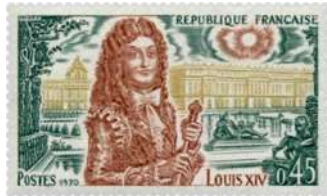
gegraveerd door Albert Decaris

Gegraveerde kunstwerkjes horen thuis in esthetica verzamelingen zoals deze over muziek- en kunstgeschiedenis.