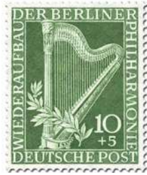
ontwerp van Goldammer

Gegraveerde zegels dragen bij tot het algemeen beeld van een klassieke thematische verzameling met een moderne toets.