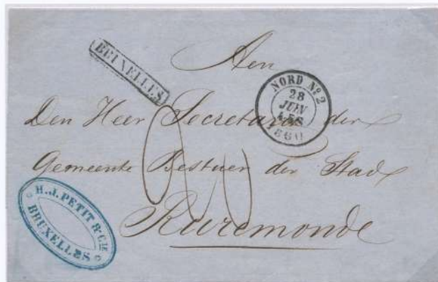
Brief gelicht in het station Brussel-Noord 10 min voor het vertrek van de trein en verwerkt in de ambulant "Nord N°2" (Brussel-Antwerpen). Zending volgens bilaterale postconventie van 17.12.1851 die voorzag dat frankeren alternatief was.

Op 5 mei 1835 werd de eerste spoorlijn op het vaste land in gebruik genomen, Brussel - Mechelen. Dit was eveneens de eerste commerciële treinverbinding ter wereld. Negen jaar later was de Noord-Zuid verbinding en de Oost-West verbinding klaar. Vanuit Brussel kon men snel de voornaamste industriële bekkens en de Noordzee havens bereiken en zo de commerciële verbinding met het achterland rendabel maken.