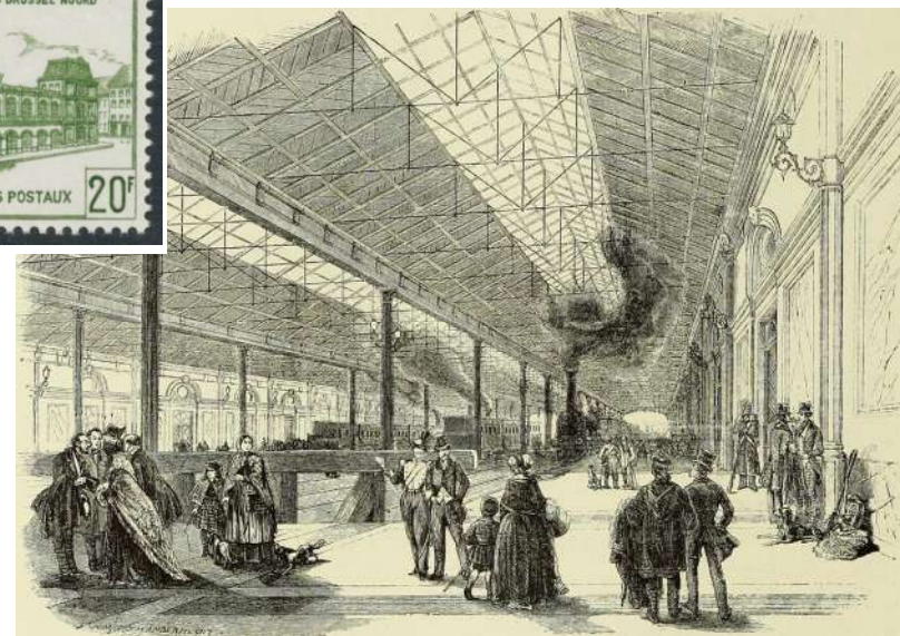
Binnenkant en buitenkant van het noordstation.

Alleen de marcofilie biedt ons een mogelijkheid.+ De lijnstempel NORD (8 lijnen) en de puntstempel 62 zijn van het postkantoor Bruxelles (NORD). Dit kantoor opende op 15/10/1861. Dus alleen medaillons zonder watermerk zijn mogelijk. In 1864 komen de puntstempels, voor Brussel Noord is dat de 62.