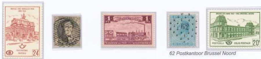
Brussel - Namur MVI Ambulant Midi 6

Door de blokkade van de Schelde door de Nederlanders, lagen de havenactiviteiten in Antwerpen stil. Onder druk van Leopold I werden in 1834 de Belgische Spoorwegen opgericht.